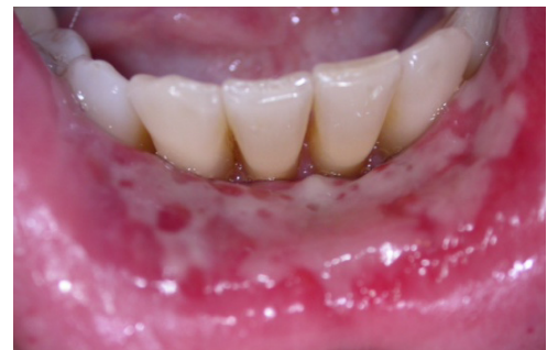
Ulceraciones Mayores Más Extensas

Generalmente, las úlceras aftosas son autolimitadas. Esto quiere decir que desaparecen por sí solas incluso sin tratamiento. La causa de las aftas es desconocida. Sin embargo, en algunos casos, pueden ser un signo de otras enfermedades afectando el cuerpo (tal como enfermedades gastrointestinales).